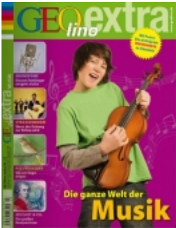
GEOlino. Sonderheft Musik.