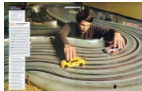
Männer-Magazin Men's Health