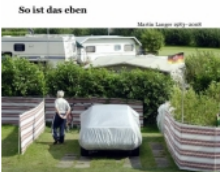
So ist das eben