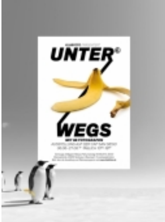
Klubfoto präsentiert: UNTERWEGS 2010-06-06 10:00 2010-06-27 18:00

Klubfoto präsentiert UNTERWEGS mit 88 Fotografen. Vernissage und Magazin-Release-Party am Samstag, 05.06.2010, 20 h