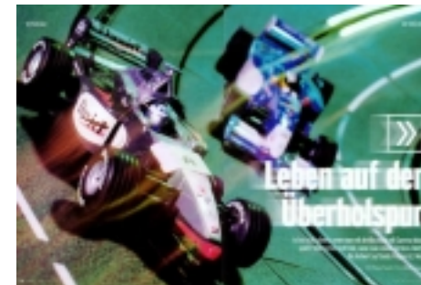
Männer-Magazin Maxim, Feature über Autorennbahnen