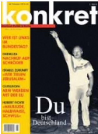
Zeitschrift Konkret, Titel