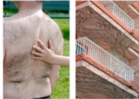
ELBaRT 2009-05-30 18:00 2009-05-31 16:00

Klubfoto präsentiert UNTERWEGS mit 88 Fotografen. Vernissage und Magazin-Release-Party am Samstag, 05.06.2010, 20 h