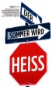
Zeitschrift MAX, Feature über neue Cabrios