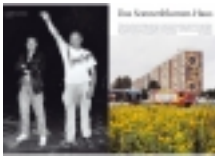
Zeitschrift NEON Magazin