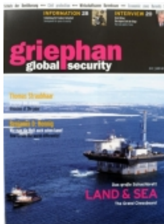
griephan. global security