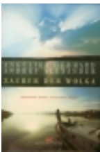
Zauber der Wolga

Abenteuer unter russischer Flagge Verbotene Expedition auf der Wolga mit einem deutschen Schiff , das mit russischer Flagge getarnt ist